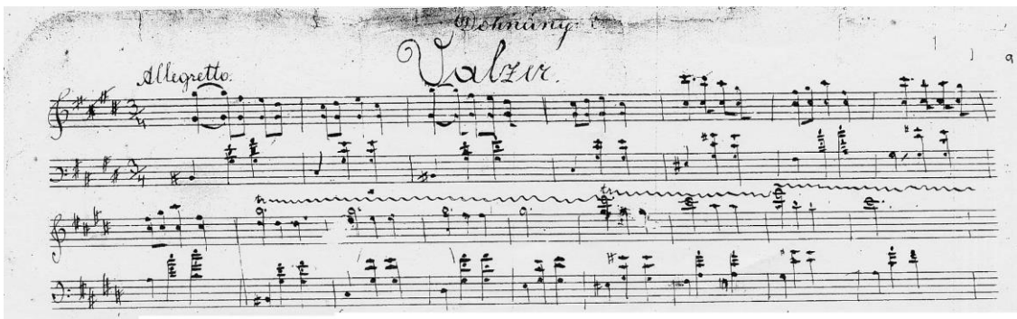
1. kottapélda: A cisz-moll keringő kezdete, British Library (London) - Add. MS. 50,790, fol. 9

Már a gyermek Dohnányi zongorára írott szerzeményei között találunk táncdarabokat: tarantellákat, mazurkákat és egy „Valzer”-t. Utóbbit cisz-mollban, tizenegy éves korában, Pozsonyban vetette papírra (1. kottapélda).