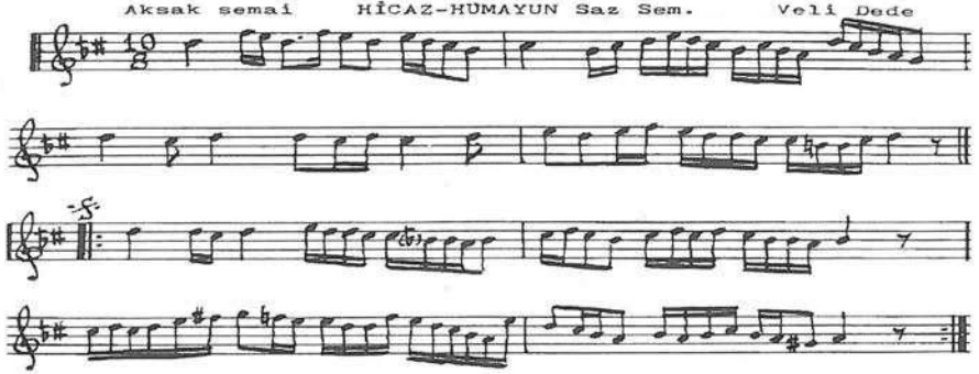
Örnek 5: Türk Sanat Müziğinin bir Hicaz Hümayun makamı (Signal 2004:79)

rünüyor. Mevlevi dervişlerin repertuvarlarının 16-20. yüzyıla kadar ünlü TSM kompozisyonları içerdiğini biliyoruz. Örneğin Köçek Derviş Mustafa Dede (17. yy.), Dede Efendi (18-19. yy.), Rauf Yekta (19-20. yy.) isimleri sayılabilir. Binici makamların seyri hep böyledir hatta Türk Halk Müziğine en yakın makam olan Hüseyini makamında en tipik inici formun dışında binici form da vardır. 5'inci örnekte bir Hicaz Hümayun makamını görüyoruz. Bunun yakın varyantı örnek 2b'de daha önce verilmişti. Herhâlde iki melodinin yapısal benzerliği müzikten hiç anlamayanlar için de açıktır.