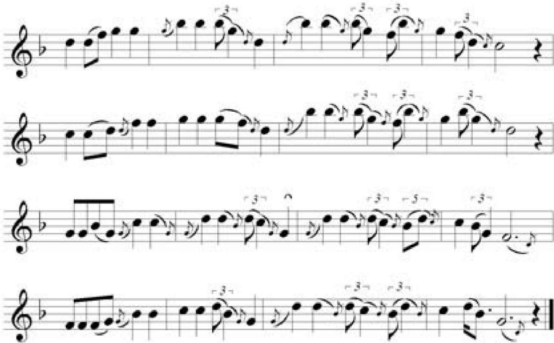
2. kotta – b) és cseremisiz párbuzama (Vikár-Berezcki 1971, No. 258)

A 2. kottában csak a csuvas és a cseremisiz stílus egy-egy dallamát látjuk, magáról a kvintváltásról és annak magyar vonatkozásairól később lesz részletesebben szó.