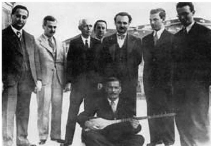
Bartók utolsó gyűjtőútja, Törökország 1936. november

Tanulmányában pedig a következőket olvashatjuk: „A 78 énekes dallam 43%-a, azaz 33 dallam tartozik az 1. és a 2. Osztályba”. Felsorolja a dallamok tulajdonságait, majd arra a következtetésre jut, hogy: „Ha összehasonlítjuk ezeket a tulajdonságokat a nyolcszótagos régi stílusú magyar dallamok tulajdonságaival, látjuk, hogy ezek szinte szó szerint megegyeznek. Azon kívül, hogy a nyolcszótagos parlando török és magyar anyag között feltűnő hasonlóság van, többet is lehet mondani: az 1. osztály kilenc török dallama, ill. variáncsoportja zömének van variánsa a magyar anyagban...”