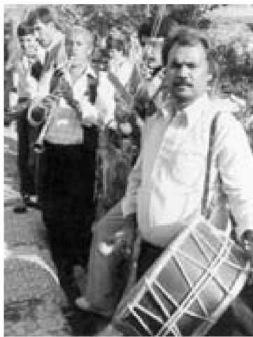
Hegedü-klarinet-dob zenél Törökország délnyugati részén

A huszonkét éves szünet után 1958-ban azonban egy nagyszabású és folyamatosan bővülő kutatássorozat kezdődött, amikor a Szovjet és a Magyar Tudományos Akadémia egyezménye lehetővé tette, hogy magyar kutatók utazzanak a Közép-Volga vidékére. Vikár László népzene-kutató és Bereczki Gábor finnugor nyelvész 1958-1979 között gyűjtöttek a területen az ott élő finnugor mordvin, votják, cseremisiz (mari) és a török csuvas, tatár, valamint baskír népek között, s a felvett mintegy négyezer dallam egy részét