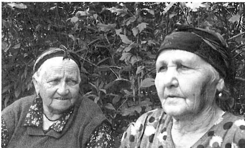
2. kép. Zahur asszonyok Ashagy-Tala falvában (zahur)