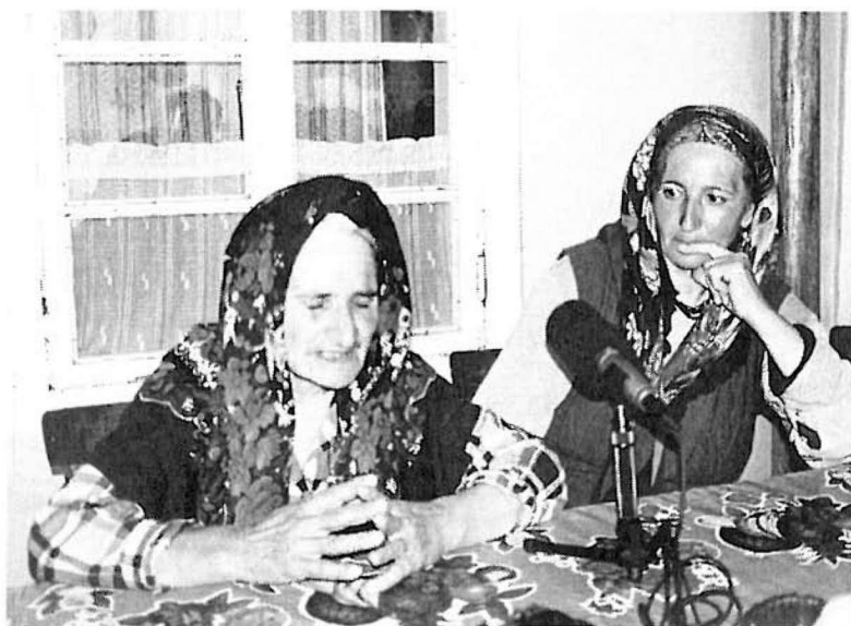
1. kép. Gyűjtés két tat asszonytól Demirchiben