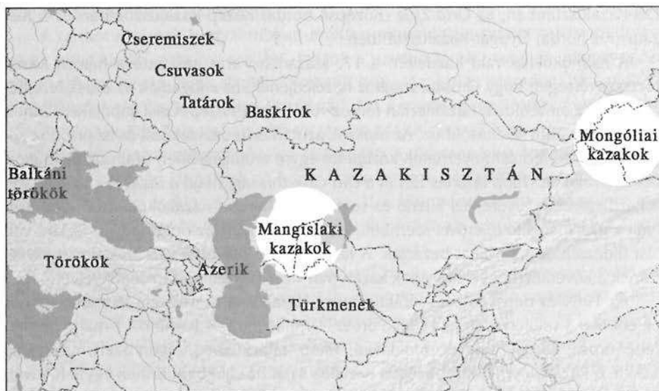
Térkép a helyekről, ahol magyar zenekutatók török népzénet gyűjtöttek

A teljes megvizsgált anyag a következő helyekről származik: Kazakisztán Mangiszlak megyéje (200 dallam 34 adatközlőtől), valamint Mongólia Bajan-Ölgij megyéje és Nalayh települése (100 dallam 25 adatközlőtől). A saját anyagon kívül átnéztem mintegy ezer publikált kazak dallamot is. 30 Ez az 1300 dallam már jó esélyt adott arra, hogy következtetéseket vonjak le a két terület zenéjének jellegzetességeiről.